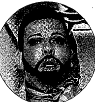
Der „Prince of Pompöös“: Stardesigner Harald Glöckler

Comeback auf Kufen: Für die neue Geburtstagsshow PLATINUM darf HOLIDAY ON ICE die Eiskunstlauf-Legende Norbert Schramm zurück auf dem Eis begrüßen. Nach 13 Jahren kehrt der bekannte Eislaufstar als Moderator der neuen Produktion auf die HOLIDAY ON ICE-Bühne zurück und wird das Publikum in Schlittschuhen durch die Show führen. Ab dem 21. November ist „Holiday on Ice“ im Grefrather EisSport & Event-Park zu Gast. Bis zum 24. November können Sie die neue Show „Platinum“, die in Grefrath ihre Premiere erlebt, dort sehen. Mit Hochspannung erwartet werden die Kostüme,