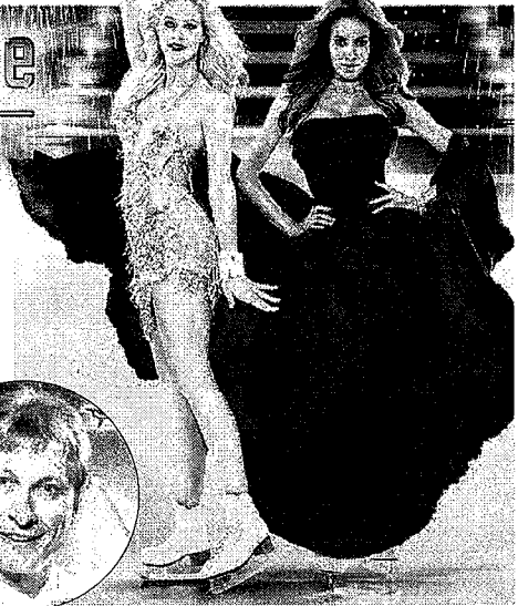
Moderiert die Show auf Schlittschuhen: Eiskunstlauf-Legende Norbert Schramm

tüme entworfen. „Ich bin ein großer Bewunderer von HOLIDAY ON ICE – sie ist eine Show der Superlative. Die weltbekannte Eisshow mit meinen Outfits auszustatten, ist eine tolle Herausforderung. HOLIDAY ON ICE ist eine Institution im internationalen Entertainment-Bereich – daher freue ich mich sehr, dass meine Kreationen nun auch ein Teil dieser beeindruckenden Show sind.“ Tickets für die Grefrather Auftritte geben gibt es in den Geschäftsstellen der JÜLICHER WOCHE.